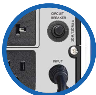
Cable de alimentación CA