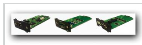
Tarjetas opcionales SNMP y de control