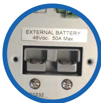
Entrada banco de baterías externas

8 terminales NEMA 5-15R, de los cuales 4 son programables