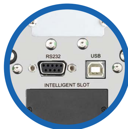
Puertos de comunicación